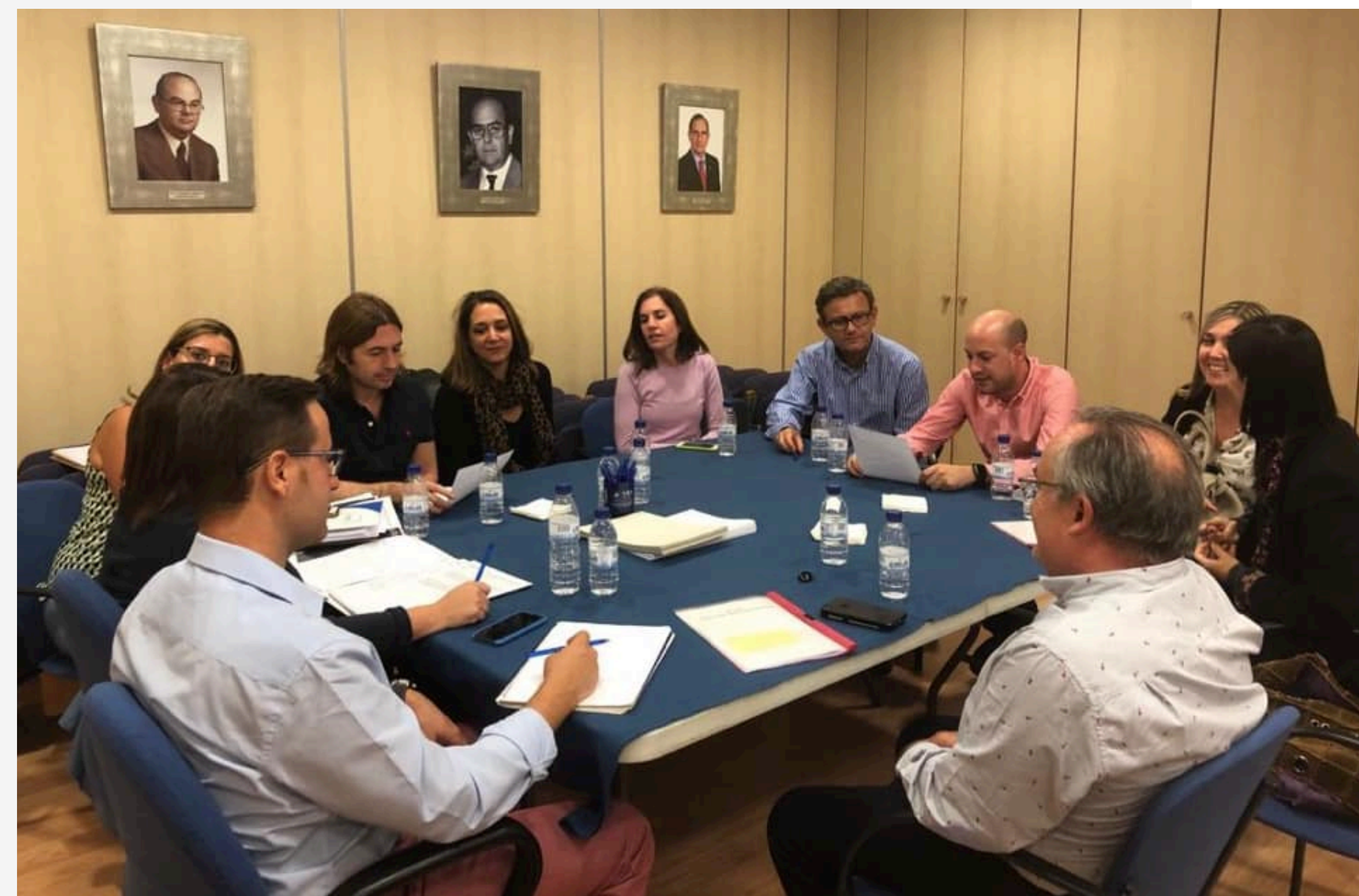
Asamblea General Extraordinaria del CODECS

Este año, la Asamblea General se celebró el día 20 de marzo de 2019 donde se aprobaron las cuentas para el ejercicio 2019 y se presentaron los informes de presidente, secretario y tesorero. Posteriormente, el día 5 de noviembre de 2019 se celebró la Asamblea General Extraordinaria con un único punto en el orden del día, la modificación de los Estatutos Colegiales en los artículos 21º Pérdida de la condición de colegiado y artículo 31º Faltas muy graves.